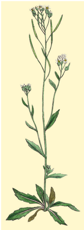
Abb 2: Arabidopsis Thaliana

10000) hat sie eine hohe Reproduktionsrate. Da Arabidopsis sehr anspruchslos ist, ist sie einfach zu kultivieren. Weiterhin sind von ihr schon viele Mutanten bekannt, deren Samen auch einfach gelagert werden können.